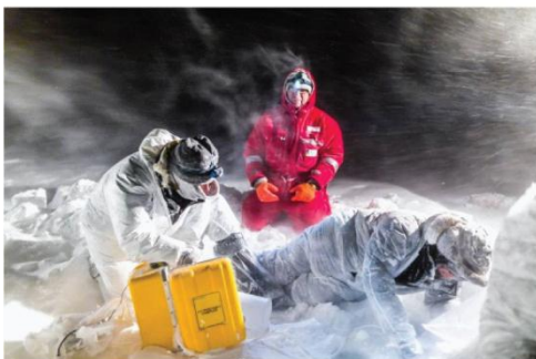
22. La récolte d'échantillons se fait parfois dans des conditions difficiles.