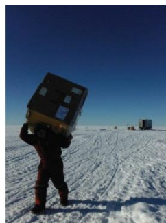
11. La travail sur le terrain peut parfois être très physique.